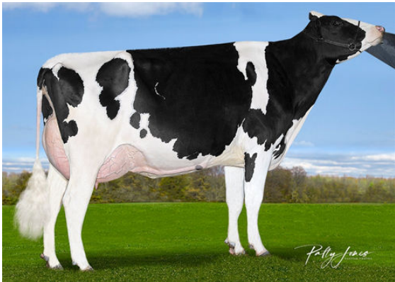
VOGUE PADAWAN ELUSIVE-P DAM