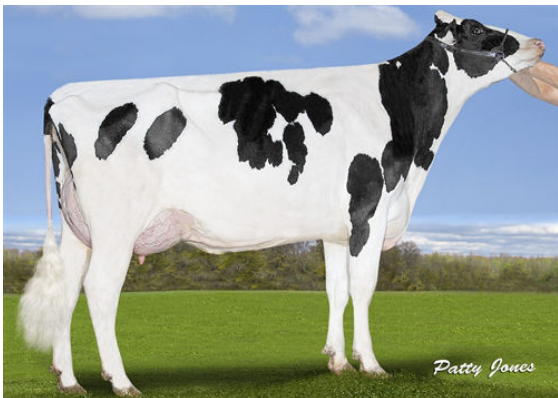
SILVERRIDGE DUKE ELSA-P GRANDDAM