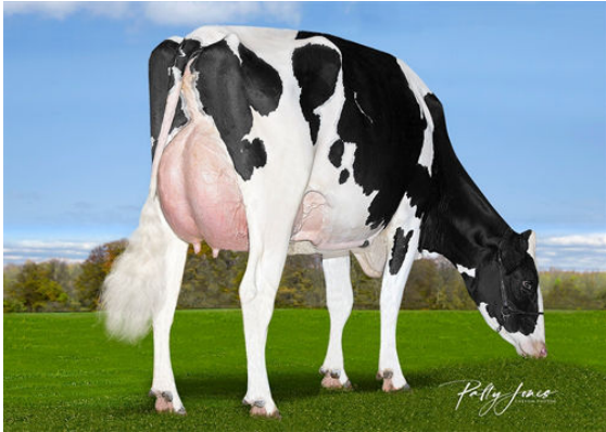
VOGUE PADAWAN ELUSIVE-P DAM